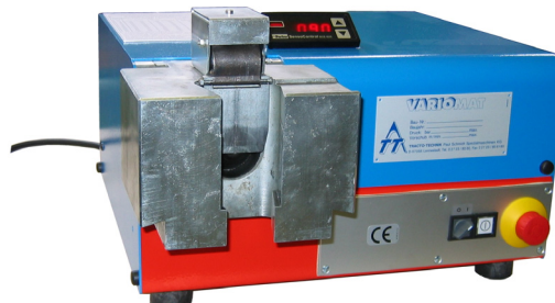
VARIOMAT avec kit d'évasement