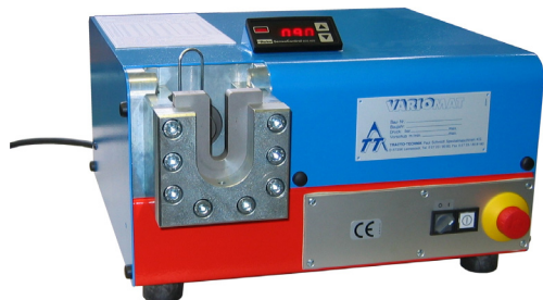
VARIOMAT avec kit de pré-sertissage